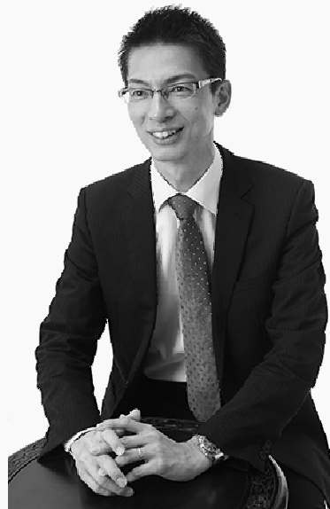
相続固定資産税コンサルタント